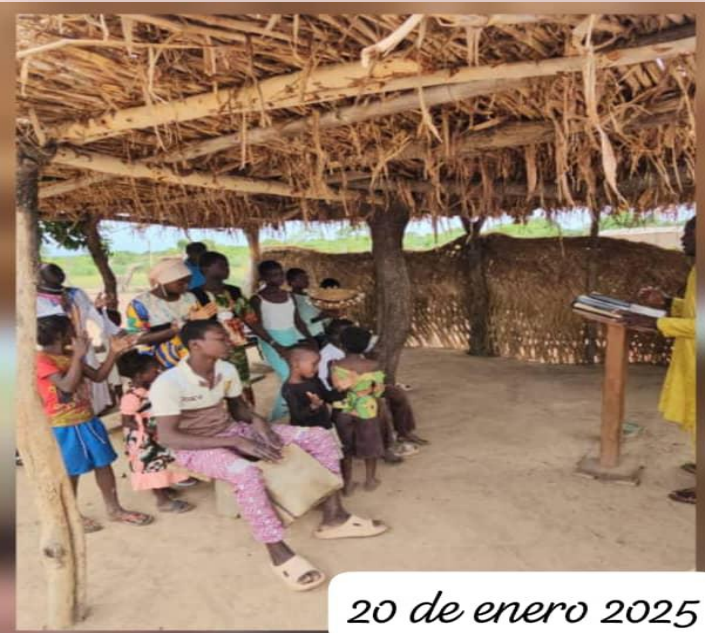
20 de enero 2025