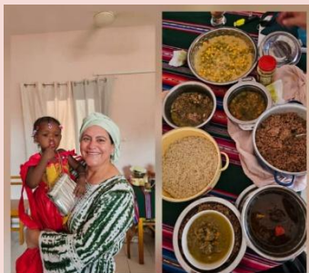
Visitas en casa por el fin del ramadam