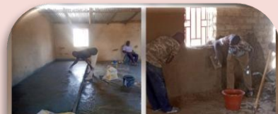
Templo de Tamala