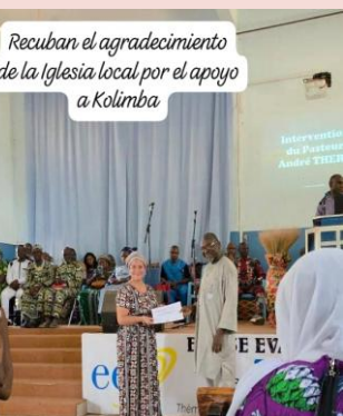
Recubran el agradecimiento de la Iglesia local por el apoyo a Kolimba

Mas información: Email: orfamy@hotmail.com WhatsApp +22390154328 Cuenta de depósitos monetarios No. 3303000177 de Banurual Bank Of América No. 00094097309