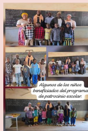
Algunos de los niños beneficiados del programa de patrocinio escolar.