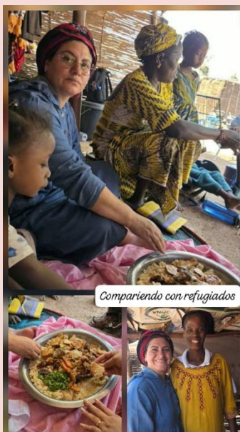
Compartiendo con refugiados