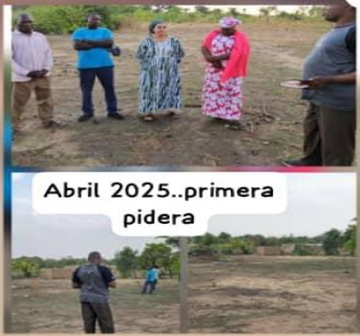
Abril 2025..primera pidera